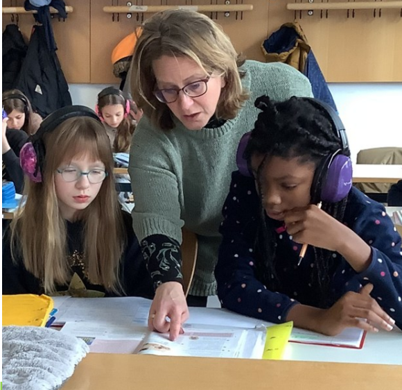
Unterstützung durch Fachlehrer auch in Lernzeiten