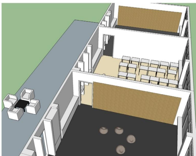
Bodentiefe Pinnwände in den Freiarbeitsräumen, darüber Schallabsorber

Für den Gebundenen Ganztag wurden die Räume H116 und H115 den veränderten Bedingungen durch kleinere Umbaumaßnahmen angepasst: Ein Raum wurde mit flexiblen Einzeltischen ausgestattet. Der zweite Raum mit dem Teppichboden, Sofaecke und Sitzsäcken, Stehtischen sowie den Regalfächern für alle SchülerInnen und der bodentiefen Korkpinnwand (in Planung) kann variabel eingesetzt werden als Ruhe- und Rückzugsraum, als Raum für Team- und Gruppenspiele, als erweiterte Freiarbeitszone, als Präsentationsraum etc. Beide Räume sind verbunden durch einen offenen Durchgang.